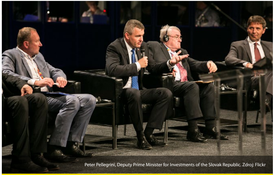
Peter Pellegrini, Deputy Prime Minister for Investments of the Slovak Republic.

Prihovára sa aj za to, aby sa pri čerpaní EŠIF riadilo verejné obstarávanie jasnými celoeurópskymi pravidlami. Väčšina chýb sú podľa neho skutočné chyby a mala by existovať možnosť konzultatívnej kontroly ex ante, kedy ich ešte je možné napraviť.