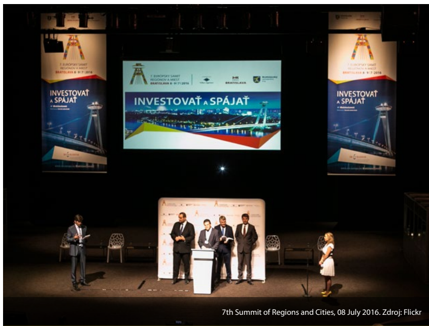
7th Summit of Regions and Cities, 08 July 2016.