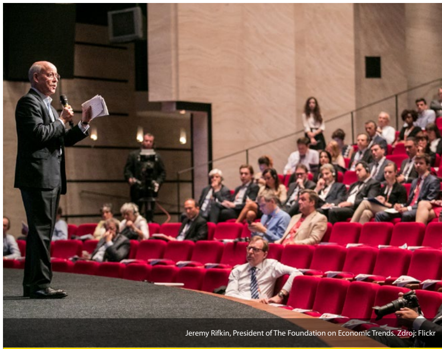
Jeremy Rifkin, President of The Foundation on Economic Trends.

Rast HDP na celom svete spomaľuje, produktivita už takmer desaťročie takmer všade klesá, predpovede na najbližších 20 rokov pri zachovaní súčasných modelov sú negatívne. Výsledkom je vysoká nezamestnanosť, problémy má najmä miléniová generácia.