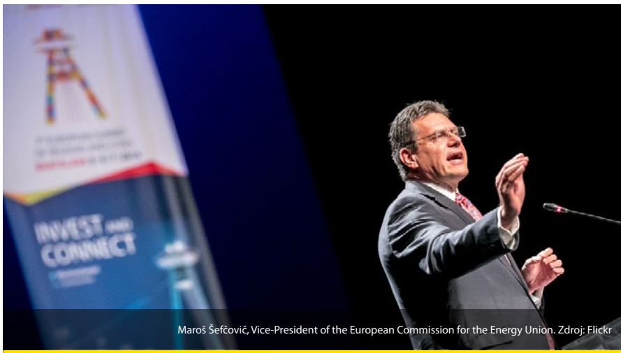
Maroš Šefčovič, Vice-President of the European Commission for the Energy Union.

Budú sa skrátka prispôbovať trendu, ktorý by nás mal priviesť k uhlíkovo neutrálnej ekonomike v roku 2050. ■