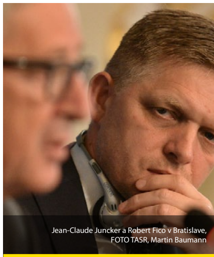
Jean-Claude Juncker a Robert Fico v Bratislave

Bratislavský summit (16. septembra) podľa premiéra nie je možný bez spolupráce s inštitúciami.